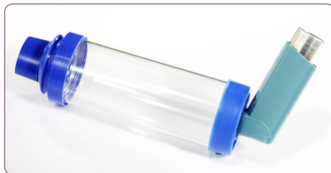
Un ejemplo de un inhalador de dosis medida con un espaciador